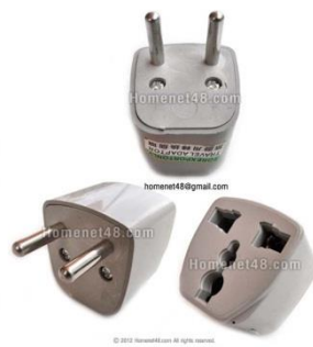
หัวแปลงจากแบนเป็นห้วกลม

เวลา: ช้ากว่าประเทศไทย 1 ชั่วโมง 15 นาที