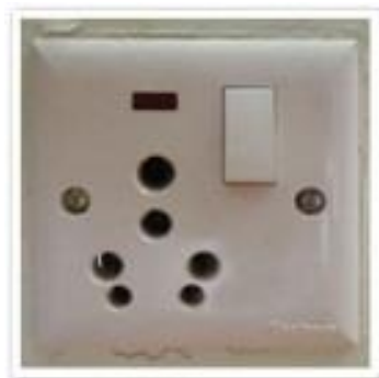
เต้าเสียบ

ปลั๊กไฟที่เนปาลเป็นแบบสามรูห้วกลมไฟ 220 โวลท์