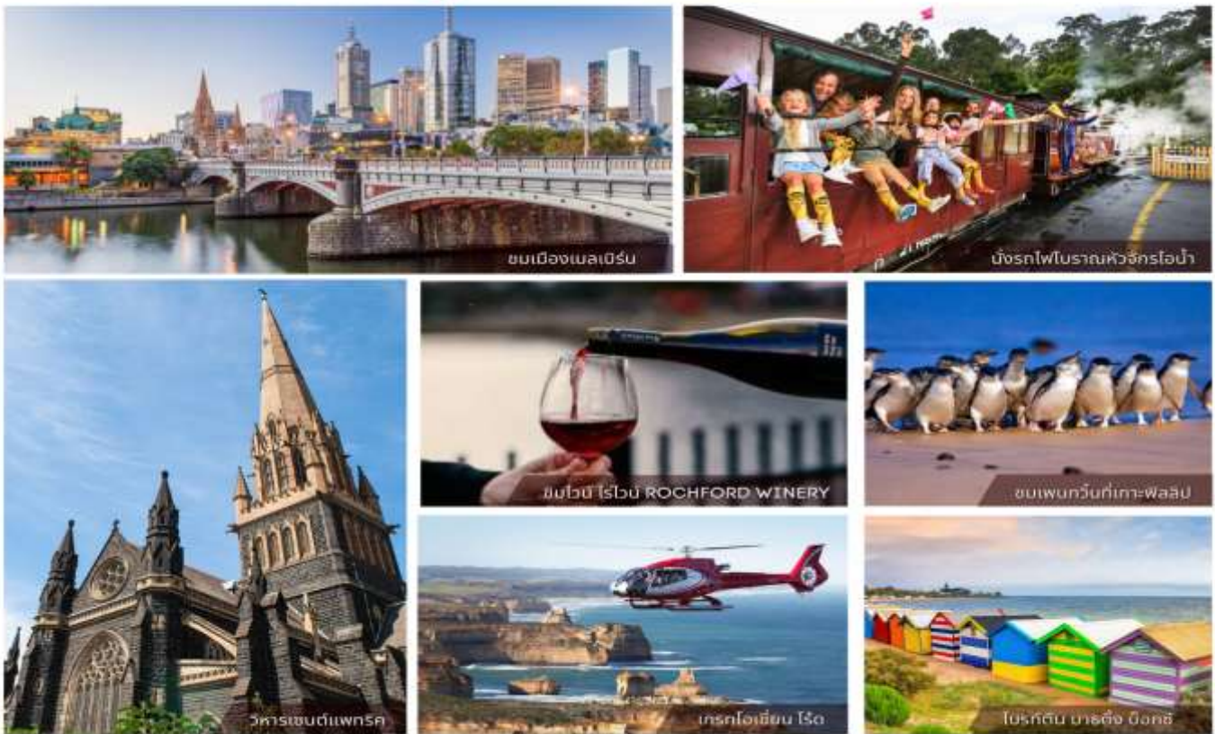
ชมเมืองเมลเบิร์น