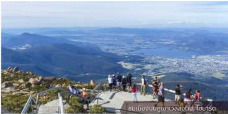
ชมเมืองบนภูเขาเวลลิงตัน, ไอบาร์ต