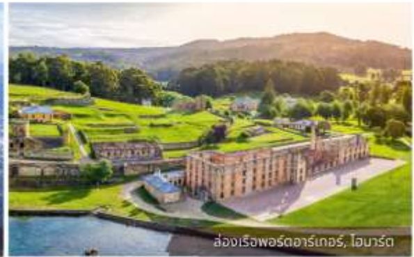
ล่องเรือพอร์ตอาร์เทอร์, ไอบาร์ต