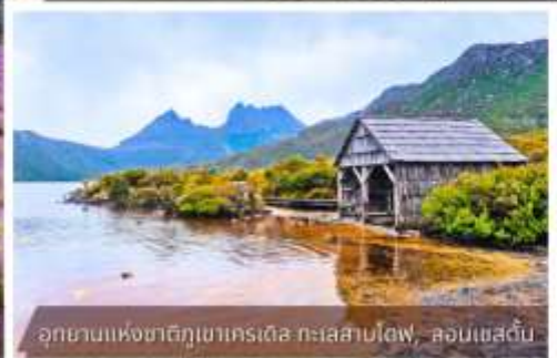
อุทยานแห่งชาติภูเขาคเรเดียล ทะเลสาบโตฟ, ลอนเนสตัน