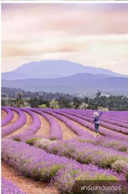
ฟาร์มลาเวนเดอร์