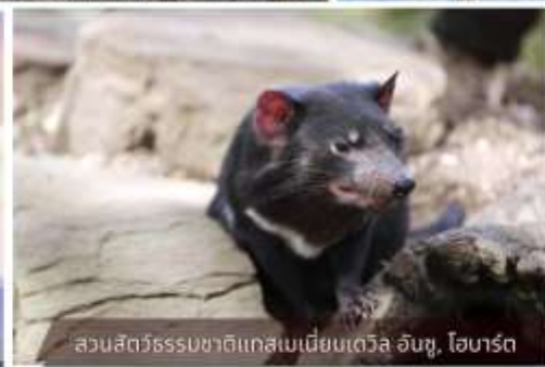
สวนสัตว์ธรรมชาติแทสเมเนียเดวิล อินซู, ไอบาร์ต