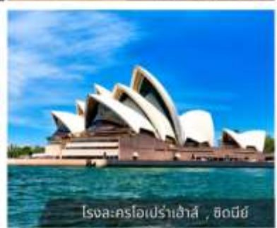
โรงละครโอเปร่าเฮ้าส์, ซิดนีย์