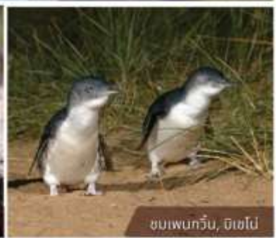
ชมเพนกวิน, ดิเซโป