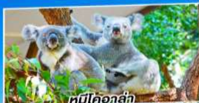
หมีโคอาล่า