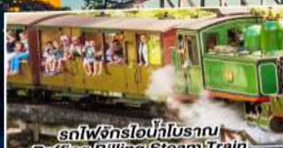
รถไฟจักรไอน้ำโบราณ Puffing Billington Steam Train