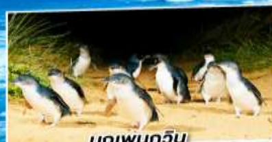
นกเพนกวิน