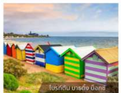
โบสถ์ต้น บาร์ดิง บ็อกซ์