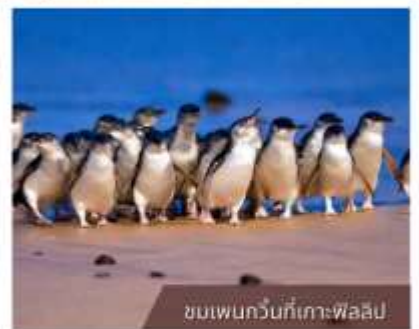
ชมเพนกวินที่เกาะฟิลลิป