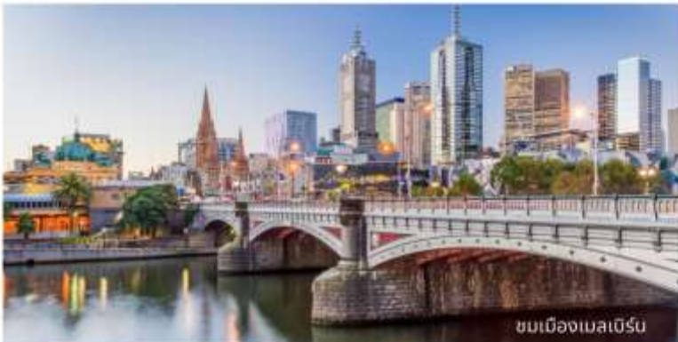
ชมเมืองเมลเบิร์น