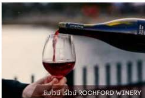
ชิมไวน์ ไวน์ ROCHFORD WINERY