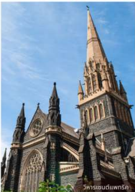
วิหารเซนต์แพทริค