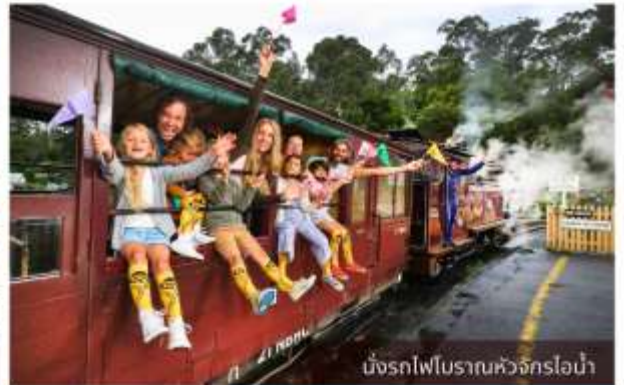
นั่งรถไฟโบราณหัวจักรไอน้ำ