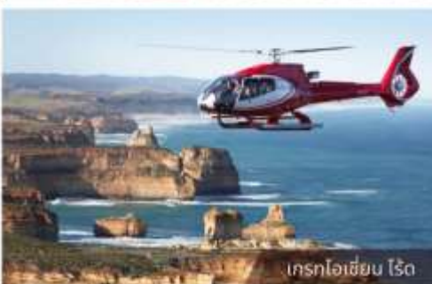
เกรทไฮซีน ไรด์