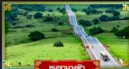
หุบเขานางฟ้า