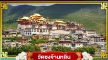
วัดชงจ้านหลิน

เยือนแหล่งมรดกโลกและเมืองเก่าสุดคลาสสิก “นั่งกระเช้าขึ้นภูเขาเฉิมะม้งกรดยก”