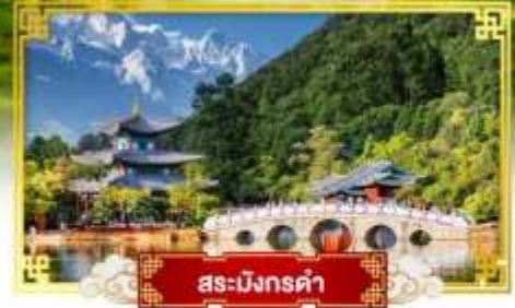
สระมังกรดำ