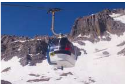
ภูเขาหิมะมังกรหยก (น้ำทะเลสาบใหญ่)

พักที่ FENGHUANG HOTEL ระดับ 4 ดาวท้องถิ่นหรือเทียบเท่าในเมืองลี่เจียง