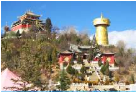
วัดลามะชวงจ้านหลิง

พักที่ SHU JIN MU YUN HOTEL ระดับ 4 ดาวท้องถิ่นหรือเทียบเท่าในเมืองเซงกรีล่า