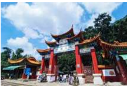
ตำหนักทงจินเตียน

พักที่ WENDING HOTEL ระดับ 4 ดาวท้องถิ่นหรือเทียบเท่าในเมืองฉู่สง