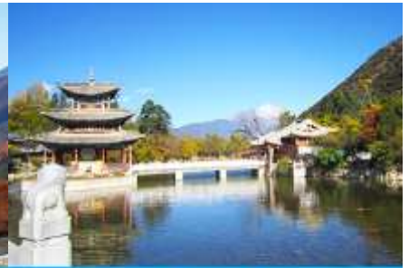
สะพานมังกรดำ

วันที่สี่ เมืองเซงกรีล่า – วัดชวงจ้านหลิง – เดินทางสู่เมืองลี่เจียง – สะพานมังกรดำ – เมืองโบราณลี่เจียง