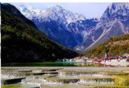
หุบเขาพระจันทร์สีน้ำเงิน "ไป๋ส่วยเหอ"