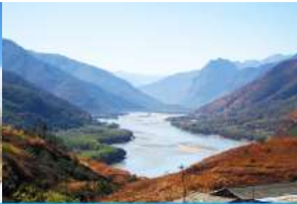
โค้งแรกแม่น้ำแยงซี