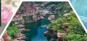
อุทยานหยุนโตซาน