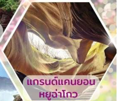
แกรนด์แคนยอนหยูจ่าโกว