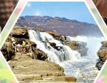
น้ำตกหูโซ่ว