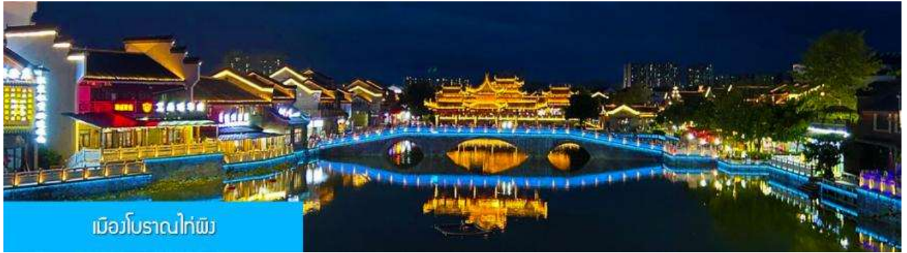
เมืองโบราณไท่ผิง