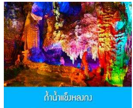
ถ้ำน้ำแข็งหลงกวง