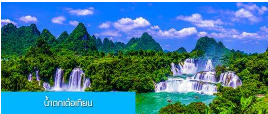
น้ำตกเต๋อเทียน

พักที่ MAN DALA HOTEL ระดับ 4 ดาวท้องถิ่นหรือเทียบเท่าในเมืองจงจั่ว