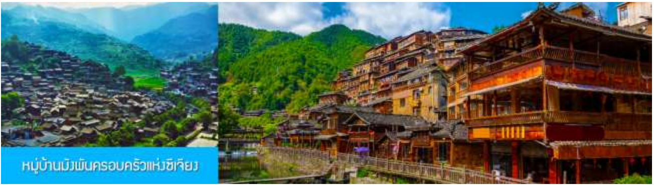
หมู่บ้านม้งพันครอบครัวแห่งซีเจียง