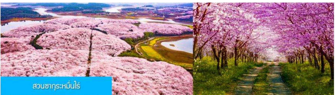
สวนซากุระหมิ่นไ่

พักที่ JIAN JIAN DUJIA HOTEL โรงแรมระดับ 4 ดาวท้องถิ่น หรือเทียบเท่าในหมู่บ้านม้ง