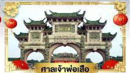
ศาลเจ้าพ่อเสือ