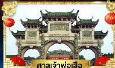
ศาลเจ้าพ่อเสือ