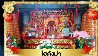
โฮตังม่า