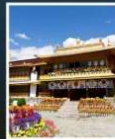
ท่าหนักนอร์บุหลิงฆา