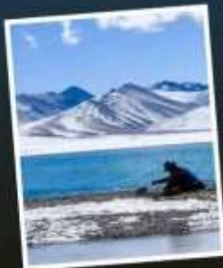
ทะเลสาบน้ำมู่ชั่ว