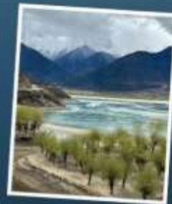
อุทยานเขาเป็นยี่