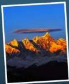
ยอดเขาหนานเจียปาหว่า