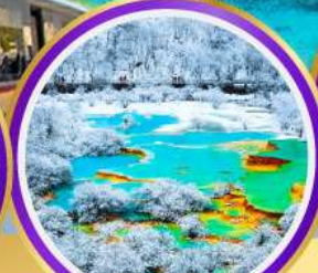
อุทยานหลวงหลง