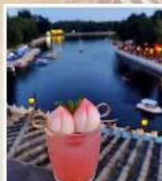
TANG FANG CAFE