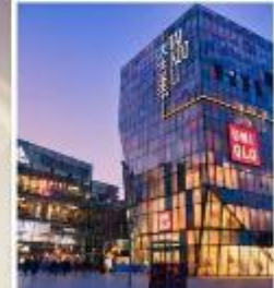
ย่านซานหลี่ถุน