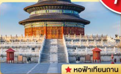
★ หอฟ้าเทียนถาน