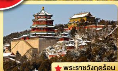
★ พระราชวังฤดูร้อน