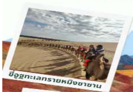
ขบวนคาราวานอูฐ