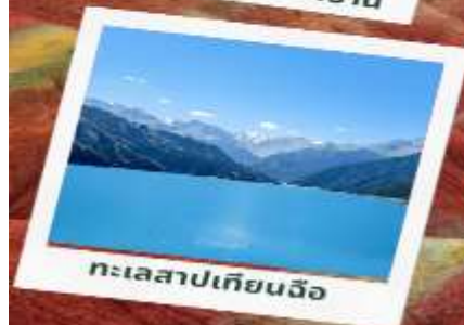
ทะเลสาบเทียนฉือ