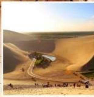
สะพานวพระจันทร์