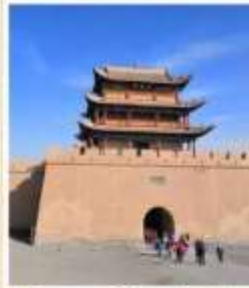
กำแพงเมืองจินด่าน เจียยวี่กวน