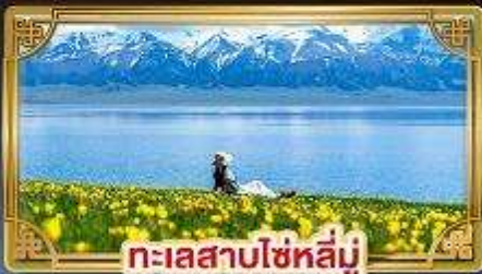
ทะเลสาบโซหลี่มู่