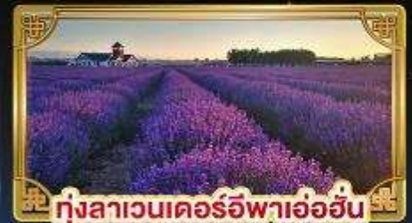
ทุ่งลาเวนเดอร์อิฟาอ้อฮิน