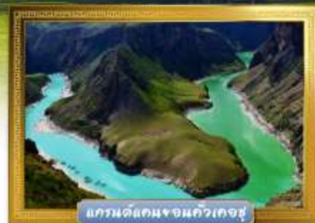
แกรนด์แคนยอนควี้เคอซู

เดินทางโดย : สายการบินโซนาเซาเทิร์นแอร์ไลน์