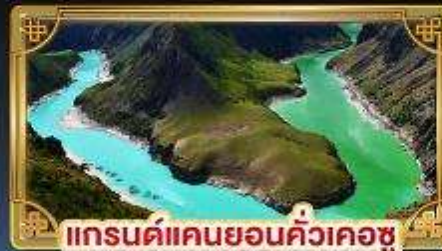
แกรนด์แคนยอนคิ้วเคอซู