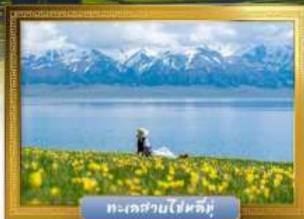
ทะเลสาบไซหลิมู่