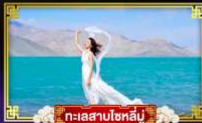
ทะเลสาบโซหลัน