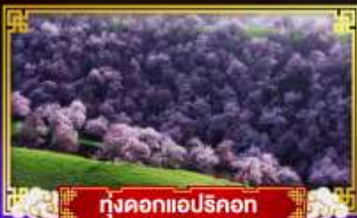
ทุ่งดอกแอปริคอต