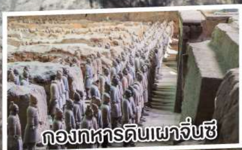
กองทัพดินเผาจิ๋นซี