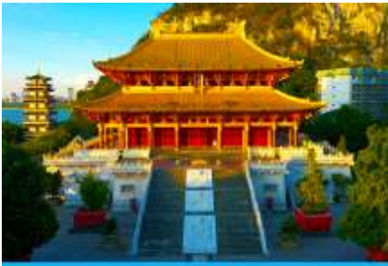
วัดขงจื้อ