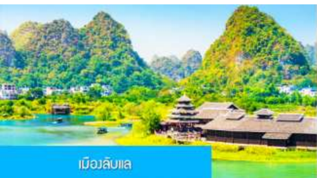
เมืองลิบเล