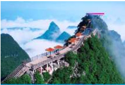
นั่งกระเช้าขึ้นเขาหฺรูอี้ฟง

พักที่ YANGSHUO ELITE GARDEN HOTEL ระดับ 4 ดาวท้องถิ่นหรือเทียบเท่าใน เมืองหยางซั่ว