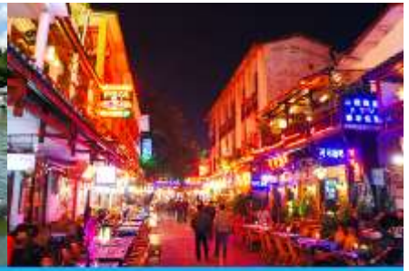
ถนนคนเดิน ซิเจียหรือถนนฝรั่ง