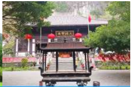
วัดซีเสี่ย