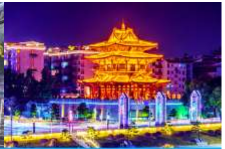
หอเซียวเหยียวโหลว

วันที่สาม เมืองหยางซั่ว-เขาหฺรูอี้ฟง- เมืองกุ้ยหลิน-ไกด์นำเสนอโปรแกรมทัวร์เสริม-ศูนย์แพทย์แผนจีน- หอเซียวเหยียวโหลว – ซ้อปิ้งย่าน ดงซีเซียง