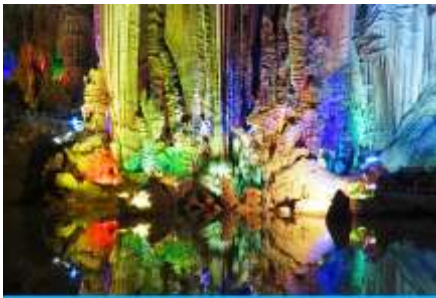
ถ้ำเจ็ดดาว

โบราณตั้งเรียงรายและพืชพันธุ์มากมายในท่านได้เพลินเพลินกับหุบเขาอันเงียบสงบ ชมความสวยงามของ ถ้ำเจ็ดดาว 七星岩 ที่ภายในเต็มไปด้วยหินงอกหินย้อยและเสาหินที่เกิดจากการหลอมละลายของหินปูน