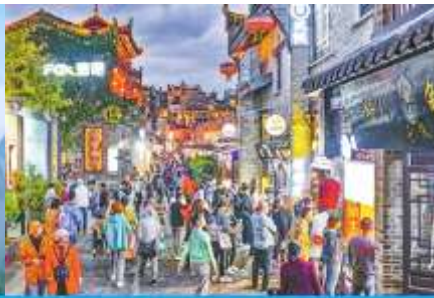
ย่าน ดงซีเซียง