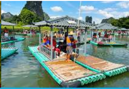
ขั้วเรือแพชมแม่น้ำหลี่เจียง