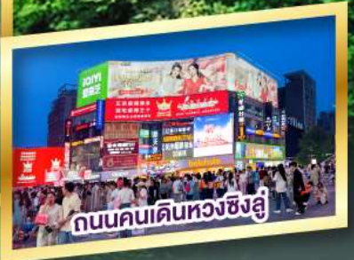
ถนนคนเดินหวงชิ่งฮู