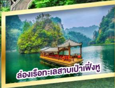
ล่องเรือทะเลสาบเป่าเฟิงหู