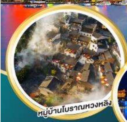
หมู่บ้านโบราณทองหลิง