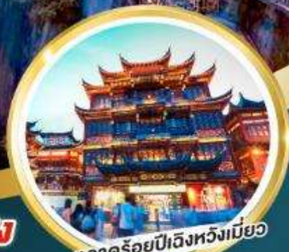
ตลาดร้อยปีเฉิงหวงเมี่ยว