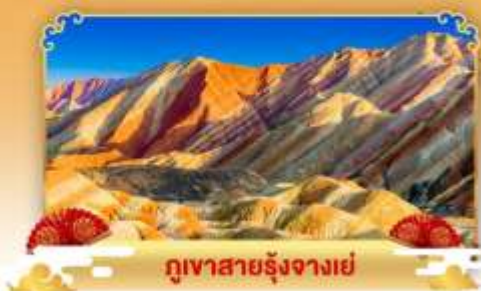
ภูเขาสายรุ้งจางเย่