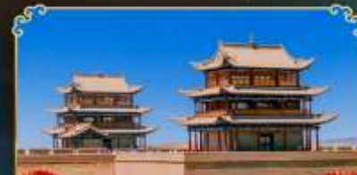
กำแพงเมืองจีนเจียวอวี่กวน