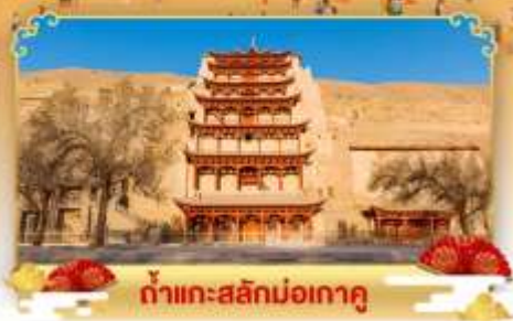
กำแพงสลักม่อเถาตู

เดินทางโดย : สายการบินไชน่าอีสเทิร์นแอร์ไลน์ & เซียงไฮ้แอร์ไลน์