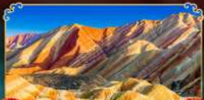
ภูเขาสายรุ้งจางเย่

เดินทางตามรอยเส้นทางสายประวัติศาสตร์โลก ชมโอเอซิสกลางทะเลทราย "ทะเลสาบพระจันทร์เสี้ยว"