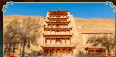
กำแพงสลักม่อเกาตุ