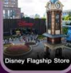
Disney Flagship Store