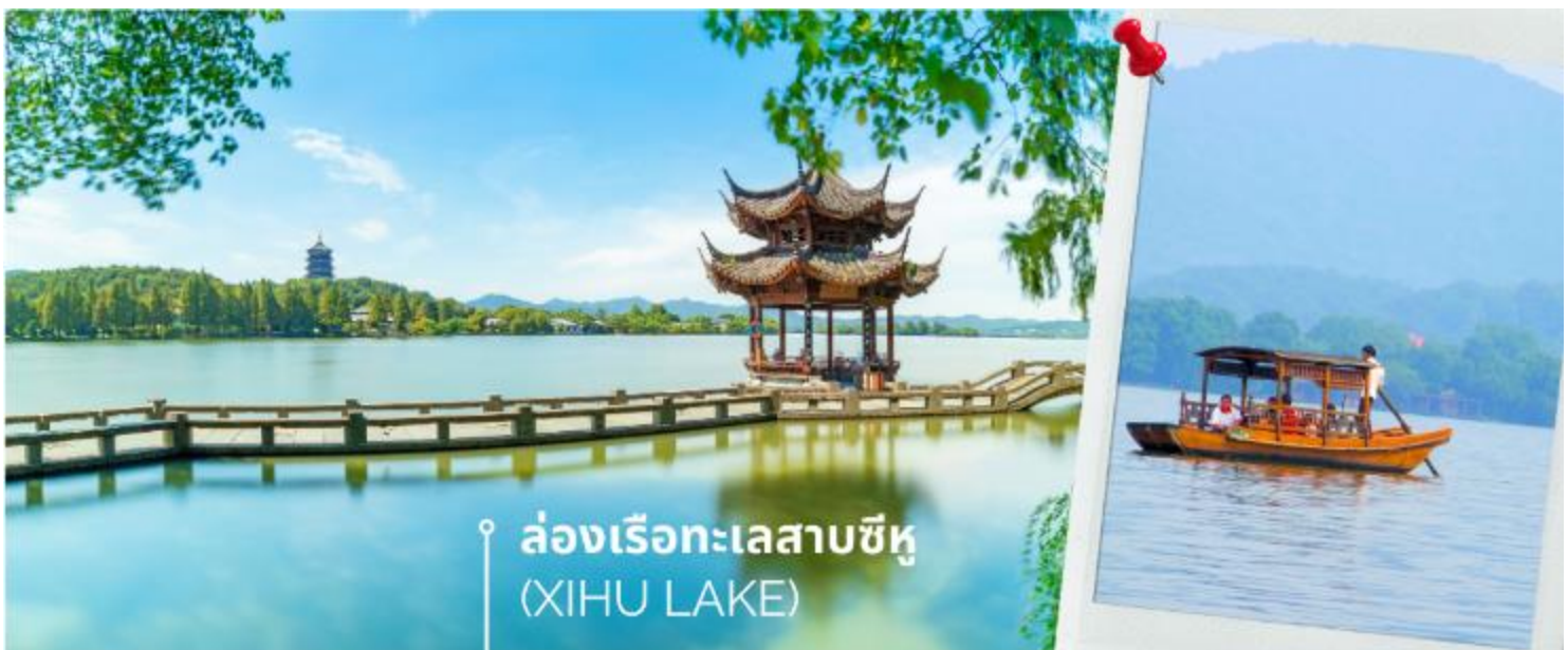
📍 ล่องเรือทะเลสาบซีหู (XIHU LAKE)

เมืองหางโจว (HANGZHOU) หรือ ฮังโจว เป็นเมืองที่ตั้งอยู่ในประเทศจีน ซึ่งตั้งอยู่ทางตอนตะวันออกของประเทศ เมืองหางโจวเป็นเมืองเก่าแก่ 1 ใน 6 ของประเทศจีน ปัจจุบันหางโจว ถือเป็นเมืองที่อยู่ในเขตภาคตะวันออกที่ได้รับการพัฒนาอย่างสูงสุดแล้ว ดังนั้นหางโจวจึงเป็นที่รู้จักกันเป็นอย่างดีว่า เป็นเมืองที่มีความสำคัญทางเศรษฐกิจ มีวัฒนธรรมที่ยาวนาน