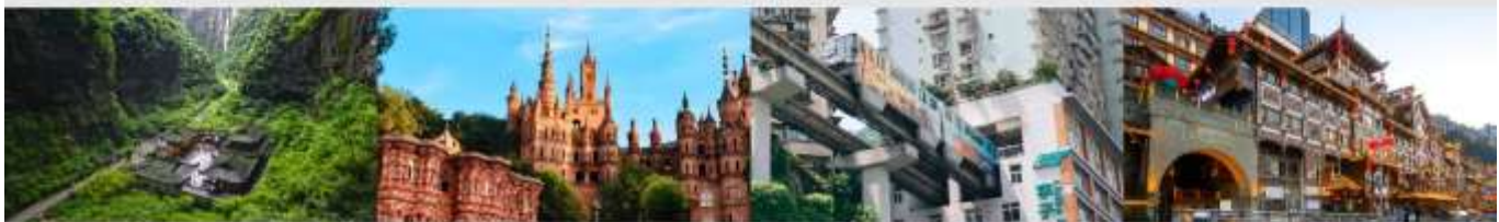
อุทยานแห่งชาติหลุมฟ้า 3 สะพานสวรรค์ Hua Sheng Yuan Dream Castle รถไฟฟ้าทะลุติ๊ก หงหยาดิ่ง