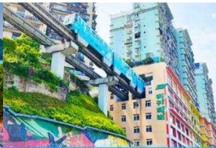
รถไฟวิงทะเลติก