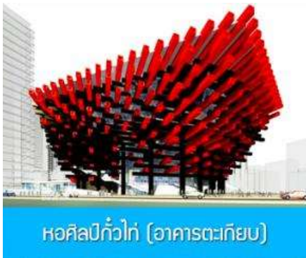
หอศิลป์กั๋วไท่ (อาคารตะเกียบ)