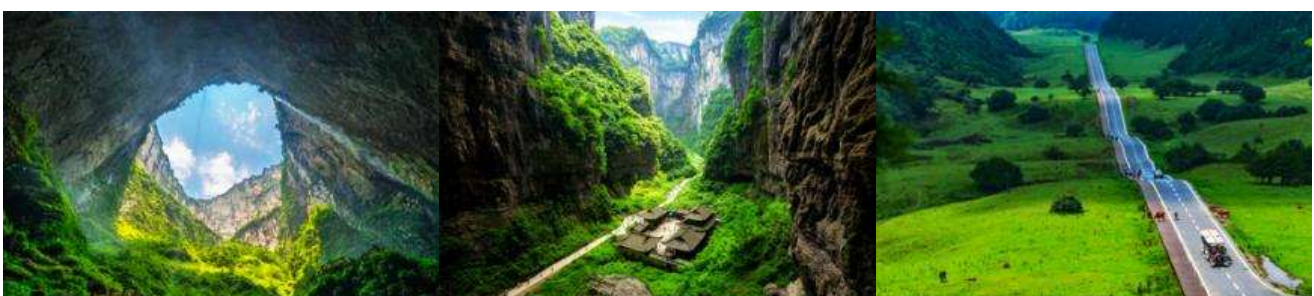
อุทยานหลุมฟ้า