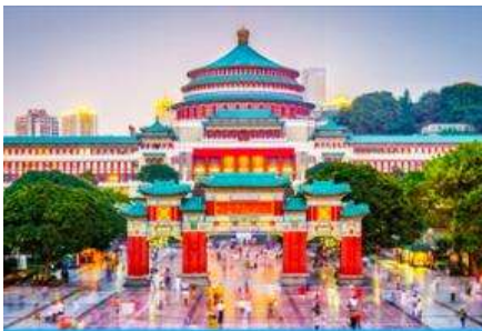
ศาลาประชาชน

พักที่ DAWEI YING HOTEL โรงแรมระดับ 4 ดาวหรือเทียบเท่าในเมืองอู่หลง