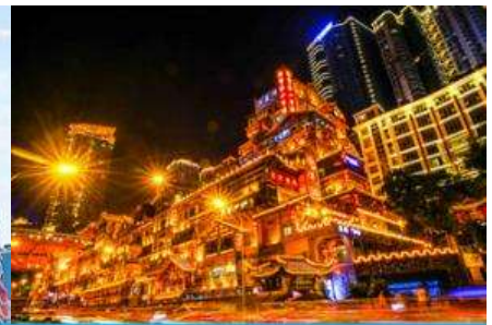
ย่านหยงหยาดัง