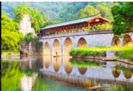
สวนเจ็ดดาว