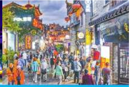
ย่าน ดงชือ่เซียง

วันที่สาม เมืองหยางชิว-เขาหญือ่ฝง- เมืองกือ่ยหลิน-ไกด์นำเสนอโปรแกรมทัวร์เสริม-ศูนย์แพทยัแผนจัน- หอชือ่ยวเหยาโหลว – ซ้อปั้งย่าน ดงชือ่เซียง