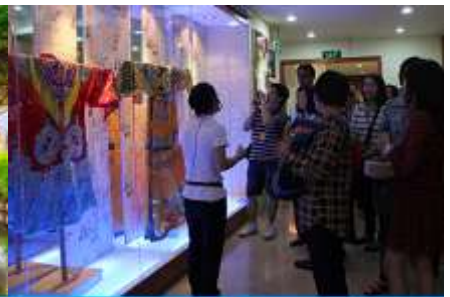
ร้านผ้าไหม

วันที่ 1 เมืองกุ้ยหลิน –เขาวงว้าง-ศูนย์จำหน่ายผ้าไหม-สวนเจ็ดดาว-เขาลูจู่-วัดซีเจีย-ศูนย์จำหน่ายหยก-ขึ้นรถไฟความเร็วสูงสู่เมืองหนานหนิง