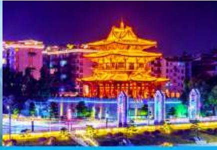
หอชือ่ยวเหยาโหลว