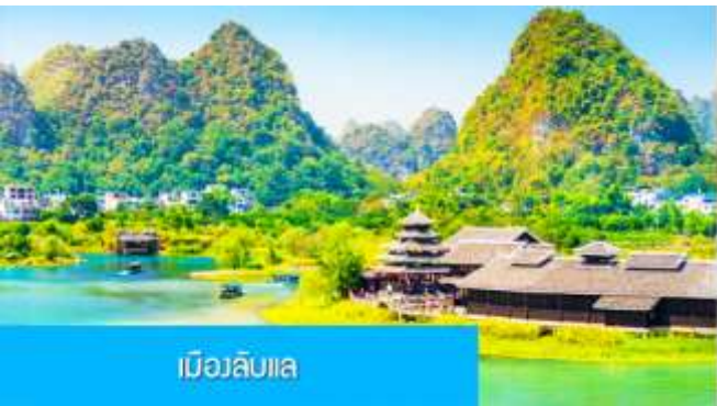
เมืองลิบไล