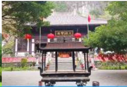
วัดซีลุน