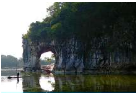
เขาวงว้าง

พักที่ GUILIN VIENNA HOTEL โรงแรมระดับ 4 ดาวท้องถิ่น หรือเทียบเท่าในเมืองกุ้ยหลิน