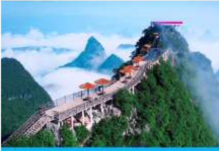
นั่งกระเช้าขึ้นเขาหญือ่ฝง