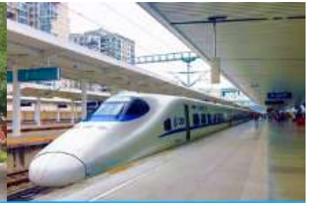
นิ้รถไฟความเร็วสูง