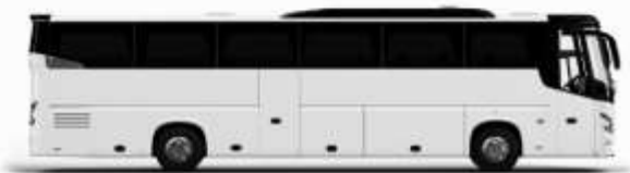
ตัวอย่างรถทัวร์ 1 คัน

ค่าที่พักตามที่ระบุในรายการหรือเทียบเท่าระดับเดียวกัน (ห้องพักละ 2 ท่าน) หากประเภทห้องพักที่ระบุไว้ไม่มีในรายการ เช่น วิววิวห้องพักเป็น TWIN BED หรือ DOUBLE BED ทางบริษัทขอสงวนสิทธิ์ในการปรับประเภทห้องพัก เป็นตามที่โรงแรมมีอยู่ โดยไม่ต้องแจ้งให้ทราบล่วงหน้า