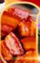
หมูคางพอ