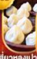
เสี่ยวหลงเปา