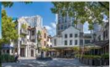
ย่านซินเทียนตี้

*ทางบริษัทฯ ขอสงวนสิทธิ์ในการสลับโปรแกรมทัวร์ตามความเหมาะสมขึ้นอยู่กับสถานการณ์ใช้งาน โดยคำนึงถึงผลประโยชน์ของลูกค้าเป็นสำคัญ