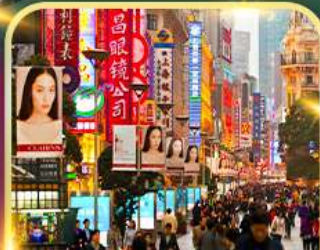
เดินเล่นถนนหนานจิง