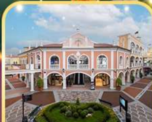
ช้อปปิ้ง FLORENTIA VILLAGE OUTLET