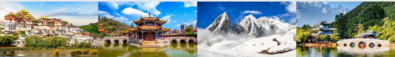
วัดลามะชงจันหลิน