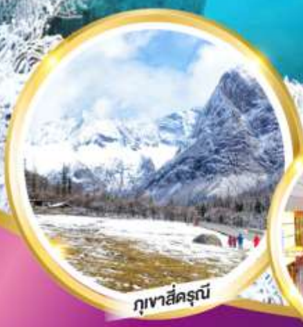
ภูเขาสี่ครุณี