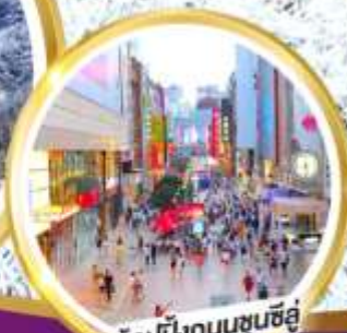
ช้อปปิ้งถนนชุนชิว