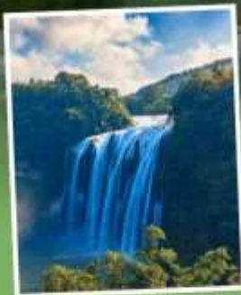
น้ำตกหวงกั๋วซู่