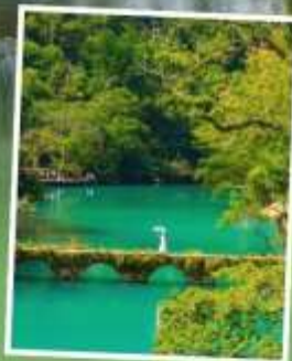
อุทยานเสี่ยวซีโขง