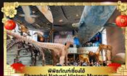
พิพิธภัณฑ์เซี่ยงไฮ้ Shanghai Natural History Museum