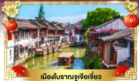
เมืองโบราณจูเจียเจียว