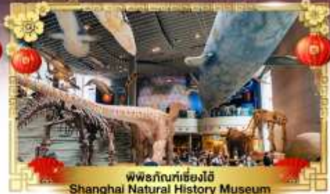
พิพิธภัณฑ์เซี่ยงไฮ้ Shanghai Natural History Museum

เดินทางโดย : สายการบินไชน่าอีสเทิร์นแอร์ไลน์