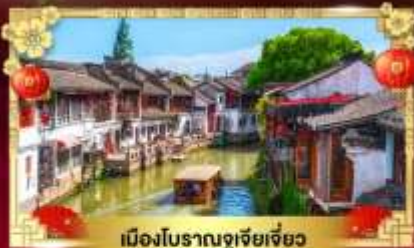
เมืองโบราณซูเจียเจียว

สนุกเต็มพิกัด "สวนสนุกดิสนีย์แลนด์เซี่ยงไฮ้"