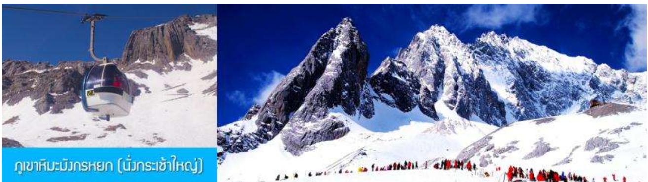
ภูเขาหิมะมังกรหยก (น้ำกระเซ็นใหญ่)

พักที่ FENGHUNG YANGSHENG HOTEL ระดับ 4 ดาวห้องถิ่นหรือเทียบเท่าใน เมืองลี่เจียง