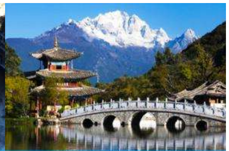
สะพานน้ำมังกรดำ