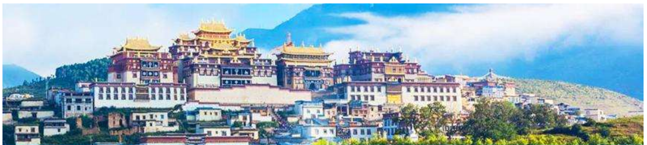
เมืองโบราณแชงกรีล่า