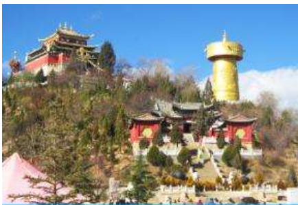
วัดลามะซวงจ้านหลิง

พักที่ SHU JIN MU YUN HOTEL ระดับ 4 ดาวท้องถิ่นหรือเทียบเท่าใน เมืองเซ่งกรี่ล่า