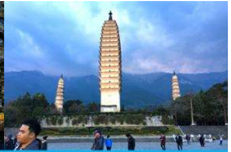
เจดีย์สามองค์

วันที่สอง นครคุนหมิง – รถไฟความเร็วสูงสู่เมืองต้าหลี่ – เมืองโบราณต้าหลี่ – ผ่านชมเจดีย์สามองค์ – เดินทางสู่เมืองแชงกรีล่า-เมืองโบราณแชงกรีล่า