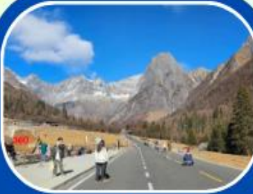
ภูเขาสีดรุณี