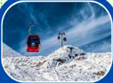
ต้ากู่ปิงชวน

ทัวร์ไม่ลงร้าน+ไม่ขายออฟชั่น+บินFullService