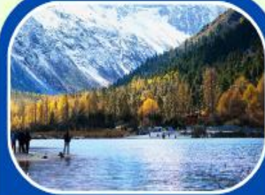
ป่ผิงโกว

เดินทาง : 17-22 พค // 20-25 มิย 8-13 กค 2568