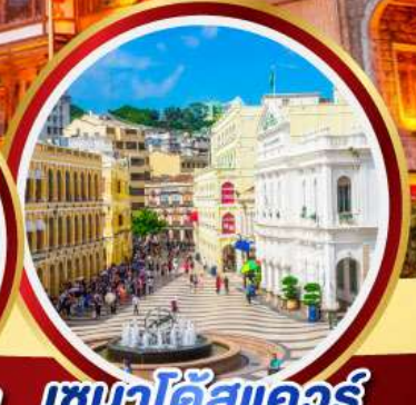
เซนาโดสแควร์