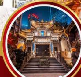
วัดหลัวอัน