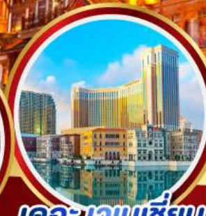
เดอะเวเนเซียน