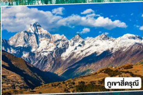
ภูเขาสี่ครุณี