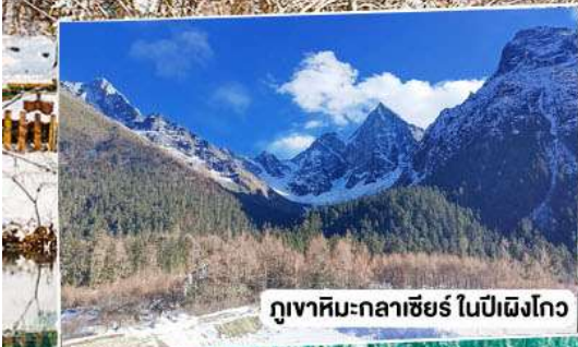
ภูเขาหิมะกลาเซียร์ ในปีฉิ่งโกว