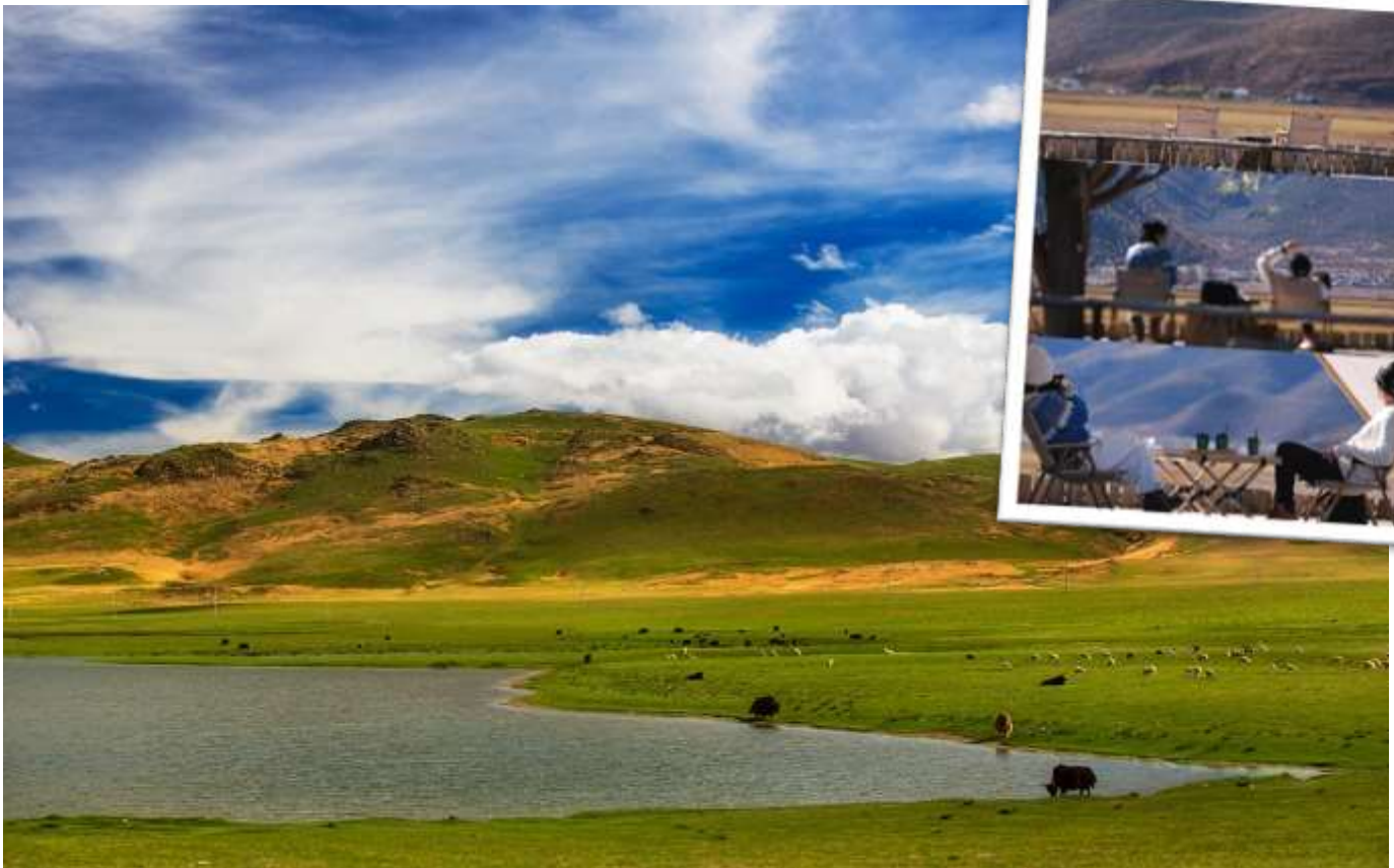
หมายเหตุ: ทิวทัศน์ขึ้นอยู่กับฤดูกาลและสภาพอากาศ

นำท่านชมความสวยงามของ ทุ่งหญ้านาพาไท อยู่สูงจากระดับน้ำทะเลกว่า 3,000 เมตร เป็นทะเลสาบที่ราบสูงตามฤดูกาล บางครั้งก็เป็นทะเลสาบพื้นที่ชุ่มน้ำที่ราบสูง บางครั้งก็เป็นทุ่งหญ้าอัลไพน์ Guiqing Grassland มีทั้งฝูงม้า ฝูงจามรี ทะเลสาบ และทุ่งหญ้าสีเขียวขจีรวมอยู่ในที่เดียว วิถีช้างหลังเป็นภูเขาโอบล้อมทะเลสาบ นอกจากนี้ ยังสามารถเข้าสู่จุดพื้นเมืองทิเบตมาใส่ถ่ายรูปที่นี่ได้อีกด้วย และแวะถ่ายรูปเชคอิน ชิมกาแฟที่คาเฟ่ BLACK BEAN COFFEE HOUSE (ไม่รวมค่าเครื่องดื่ม)