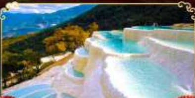
โป๋สุ่ยโก