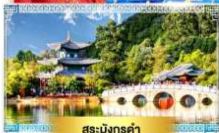
สระมังกรดำ