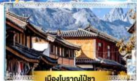
เมืองโบราณไปซา