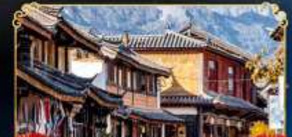
เมืองโบราณไปซา