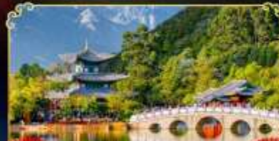
สระมิ่งกรคำ