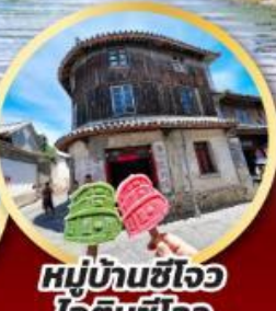
หมู่บ้านซีโจว ไอดีมซีโจว