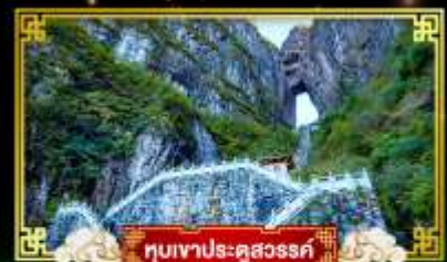
หุบเขาประติมากรรม