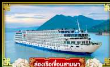
ล่องเรือเจือรสยามมา