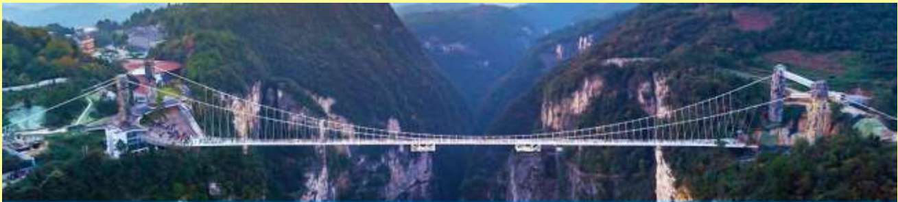
สะพานกระจกข้ามหุบเขาแกรนด์แคนยอน

โปรแกรมเสริมที่ 2 โปรแกรมเที่ยวชมอุทยานภูเขาอวตารแบบครึ่งวันที่รวมค่าขึ้นลิฟท์แก้ว (ผู้เข้าร่วมขั้นต่ำ 15 ท่าน) ใช้เวลาประมาณ 4-6 ชั่วโมง (ขึ้นอยู่กับจำนวนนักท่องเที่ยวในแต่ละวัน) อัตราค่าบริการท่านละ 750 หยวนหรือ 3,750 บาท นำท่านเที่ยวชมจุดชมวิวลำธารจินเปียนซีที่สามารถมองเห็นวิวยอดเขาอวตารได้ชัดเจน นำท่านเที่ยวชมจุดชมวิวดน ลานชมวิวน้ำลิฟท์แก้วไปหลังที่สามารถมองเห็นทัศนียภาพของภูเขาอวตารและ ลิฟท์แก้วได้ชัดเจน นำท่านขึ้นลิฟท์แก้วขึ้นสู่ยอดเขาอวตาร นำท่านเดินชมจุดชมวิวด่าง ๆ บนยอดเขาอวตาร ได้แก่ภูเขาฮาเลลูยา สะพานหนึ่งโนได้หล้า... อัตราค่าบริการรวม ค่าบัตรเข้าอุทยาน ค่ารถรับส่งภายในเขต อุทยาน ค่าน้ำดื่มของไกด์ท้องถิ่น