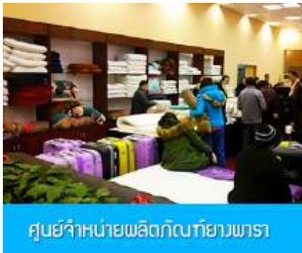
ศูนย์จำหน่ายผลิตภัณฑ์ยางพารา

พักที่ ZHENMIAN HOTEL OR YINXIANG HOTEL ระดับ 4 ดาวท้องถิ่นหรือเทียบเท่าในเมืองจางเจียเจี๋ย