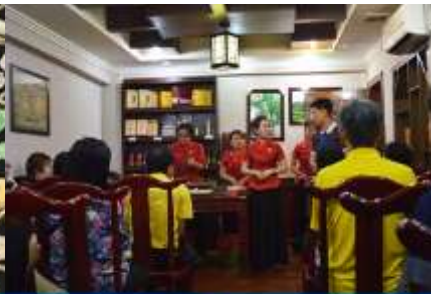
ร้านใบชา