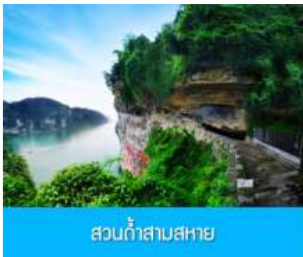
สวนอ้อสามสหาย