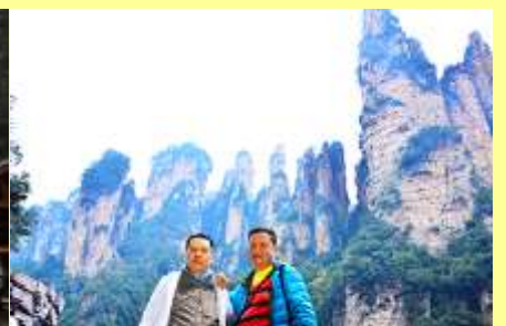
ชมจุดชมวิวลีเฟก้าแก้ว

โปรแกรมเสริมที่ 1 โปรแกรมเที่ยวชมอุทยานภูเขาอวตารแบบสั้นที่ไม่ขึ้นลิฟท์แก้ว (ผู้เข้าร่วมขั้นต่ำ 15 ท่าน) ใช้เวลาประมาณ 2-3 ชั่วโมง อัตราค่าบริการท่านละ 400 หยวนหรือ 2,000 บาท นำท่านเที่ยวชมจุดชมวิวลำธาร