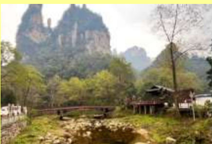
จุดชมวิวจินเปียนซี

หลังอาหารเช้าให้ท่านพักผ่อนตามอัธยาศัยในโรงแรม หรือ ท่านสามารถเลือกซื้อโปรแกรมเสริม OPTIONAL TOUR รายการใดรายการหนึ่ง ซึ่งเป็น โปรแกรมท่องเที่ยวที่ไม่ได้รวมอยู่ในรายการท่องเที่ยว ซึ่งมีด้วยกัน 3 โปรแกรม ได้แก่