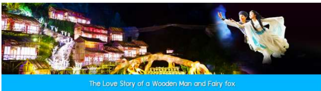
The Love Story of a Wooden Man and Fairy fox

เนื่องจากอุทยานเทียนเหมินซานมียอดจองตั๋วล่วงหน้าที่น่าแน่นในช่วงฤดูท่องเที่ยวและช่วงวันหยุดยาวของจีน ทางผู้จัดทัวร์ขอสงวนสิทธิ์ในการจัด โปรแกรมเที่ยวภูเขาเทียนเหมินซานได้ทั้งแบบ Route A และ Route B ทั้งนี้ขึ้นอยู่กับความซ้ำเร็วในการส่งข้อมูลส่วนตัว(หน้าพาสปอร์ต)ในการจองตั๋วล่วงหน้าของแต่ละคณะ