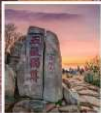
หินแกะสลักในสมัย ราชวงศ์ถัง