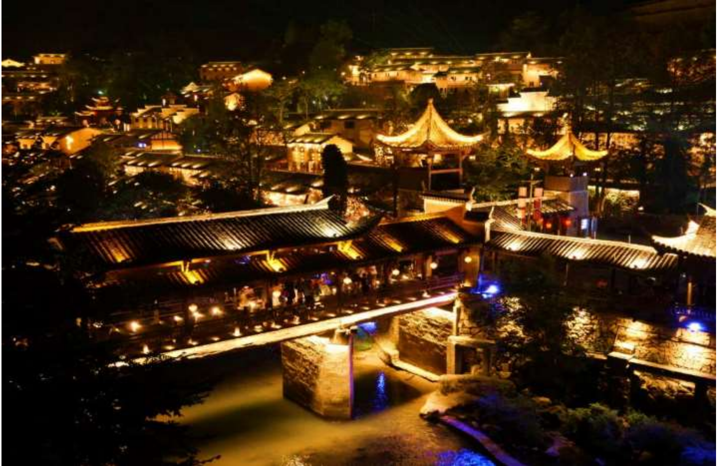
เย็น รับประทานอาหารเย็น ณ ร้านอาหารภายในหมู่บ้านเวอดา ที่พัก Shangrao Wangcao Hotel ระดับ 5 ดาว++ หรือเทียบเท่า (โรงแรมมาตรฐานจีน)