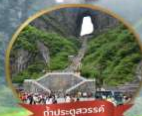
กำประตูลั่วสวร์ค