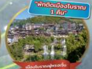
"พักติดเมืองโบราณ 1 คืน"