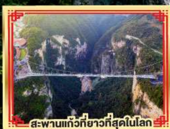
สะพานแกว่งที่ยาวที่สุดในโลก

เฑาวอดคาร เกียนเหมินชาน สองเมืองโบราณ ฟูหลงจิ้น เฟิ่งหวง