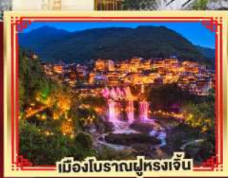
เมืองโบราณฟูหลงจิ้น