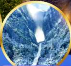
ประติมากรรม เทียนเหมินซาน