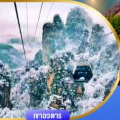
เทาอวดตาร