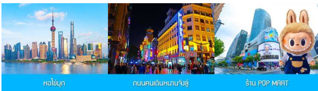
หอไข่มุก