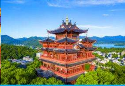
หอเจิงหวงเก้อ