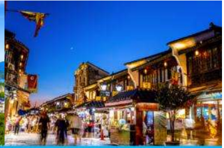
ย่านเหอฝางเจีย