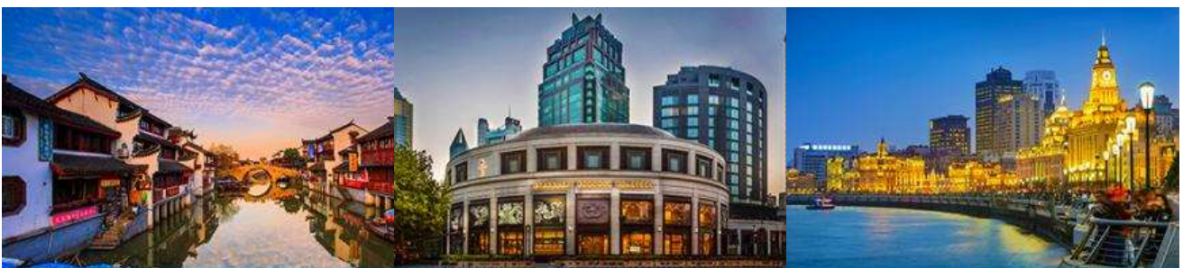
เมืองโบราณ ซีเป่า