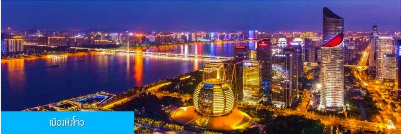
เมืองหังโจว